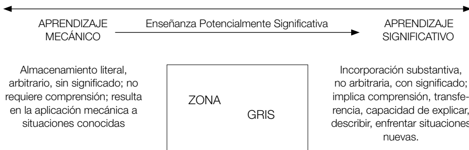
Figura 1. Una visión esquemática del continuo aprendizaje significativo-aprendizaje mecánico, sugiriendo que, en la práctica, gran parte del aprendizaje tiene lugar en la zona intermedia de ese continuo y que una enseñanza potencialmente significativa puede facilitar «el progreso del alumno en esa zona gris».

significados que no es inmediato. Al contrario, es progresivo, con rupturas y continuidades y puede ser bastante largo, análogamente a lo que sugiere Vergnaud (1990) con relación al dominio de un campo conceptual.